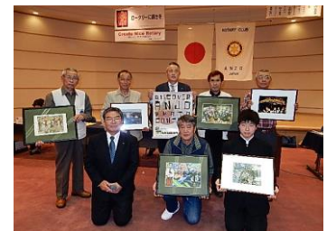
フォトコンテスト受賞者の皆様